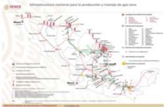
Infraestructura de gasoductos de transporte y entidades federativas con permisos de distribución por ducto

A partir de esas fuentes de suministro (nacional o importado), el gas natural se conduce mediante los sistemas de transporte, que puede ser el SISTRANGAS (Sistema de Transporte y Almacenamiento Nacional Integrado de Gas Natural) o ductos privados que llegan hasta cada una de las ciudades donde entregan a los sistemas de distribución, en la siguiente gráfica se puede ver la complejidad de la infraestructura de transporte, zonas de producción, puntos de importación, etc.